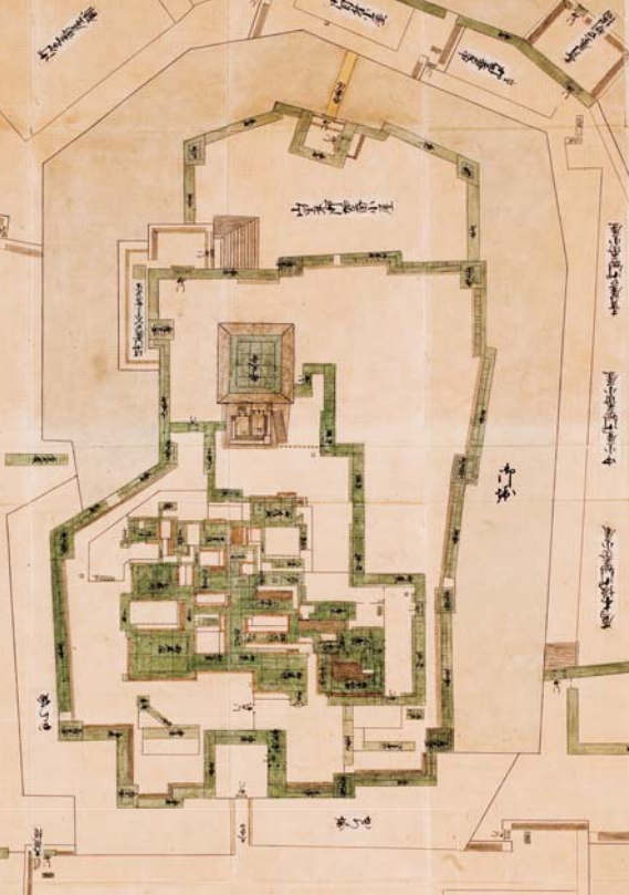
徳川時代の大坂城絵図(重文・中井家蔵)