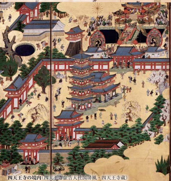
四天王寺の境内(四天王寺住吉大社図屏風・四天王寺蔵)