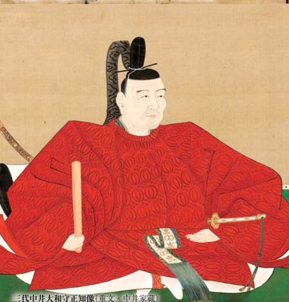
三代中井大和守正知像(重文・中井家蔵)