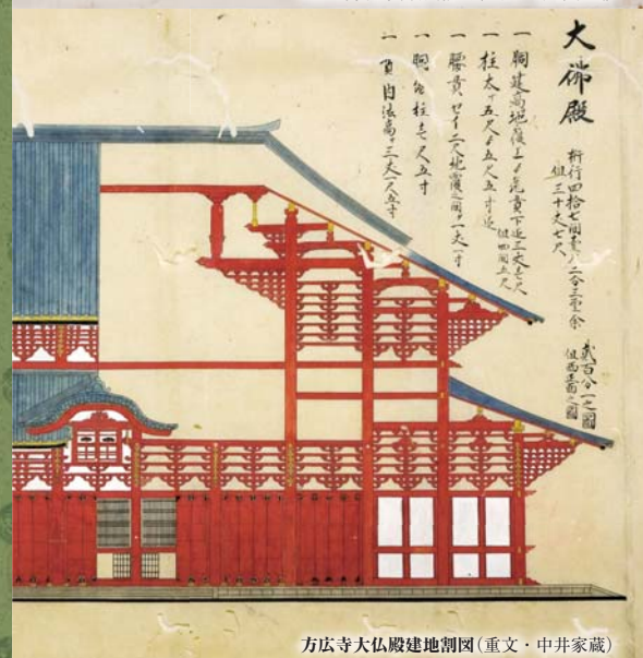
方広寺大仏殿建地割図(重文・中井家蔵)