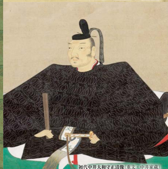
初代中井大和守正清像(重文・中井家蔵)