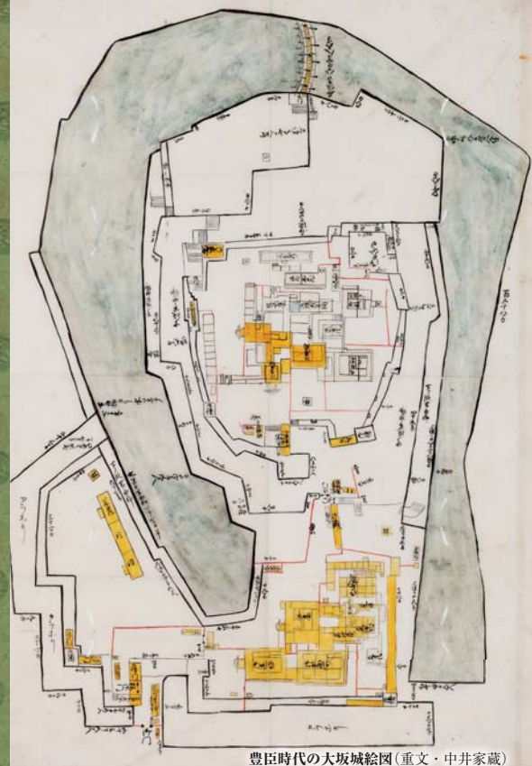
豊臣時代の大坂城絵図(重文・中井家蔵)