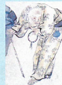
10. 踊りすぎて腰が・・・