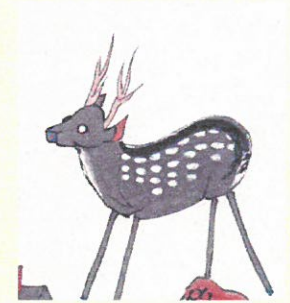
21. 角に気合入ってます