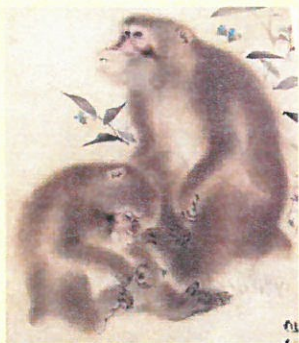
28. 身だしなみチェック