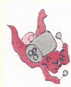
30. パーカッション担当