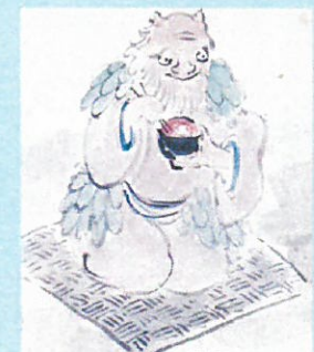
16. ぜんざい美味しいな