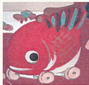
35. 可愛さトップレベル?