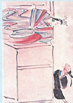
8. ロミオとジュリエット?