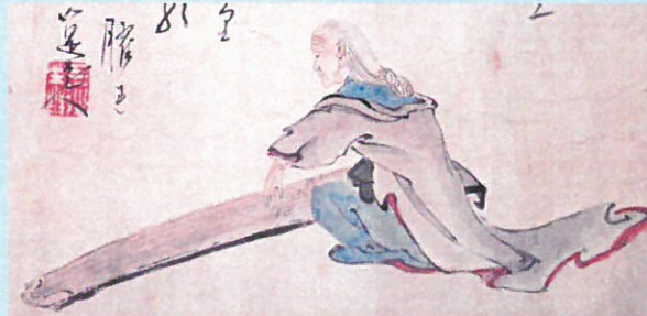
9. 琴なら誰にも負けないわ!