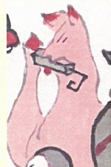
29. 特技はハーモニカ?