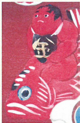
33. 恥ずかしがり屋なんです