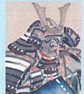
11. 流行りのコスチューム