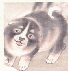
42. 毛並み なめらか