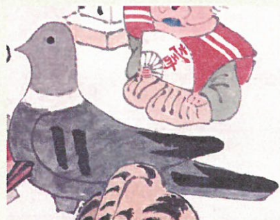
34. 豆を買うと歌います