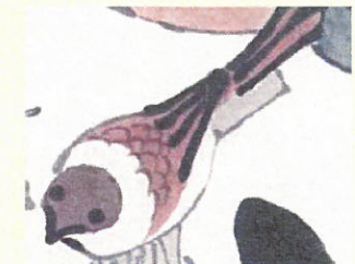
32. 歌 専門