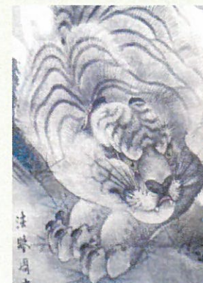
43. 迫力では負けません