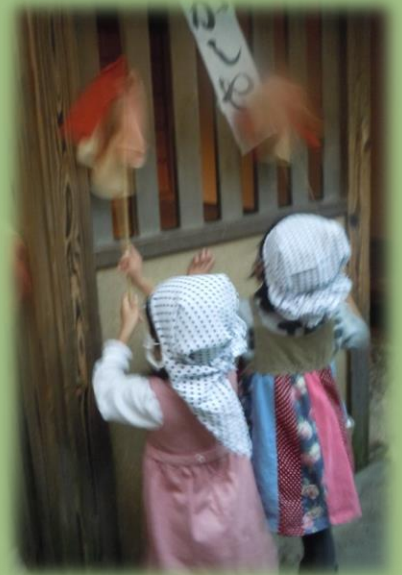
町家のお掃除方法

2016年12月17日(土)・18日(日) 13時~15時 会場 大阪くらしの今昔館 9F 常設展示室内