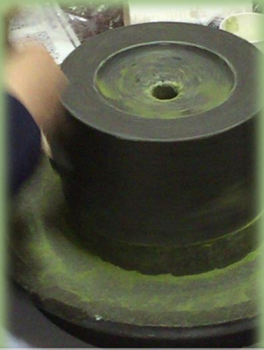
石臼でお茶を挽いてみよう

大坂の伝統的な町家の中で、和の文化をプチ体験できる特別な2日間です。 石臼でお茶を挽いたり、昔遊びをしたり、風呂敷の便利な包み方などを体験してみましょ。