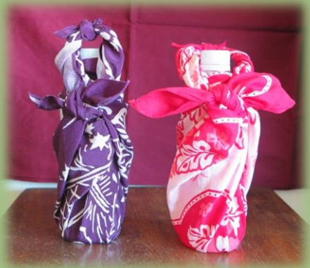
風呂敷でペットボトルを 包んでみよう