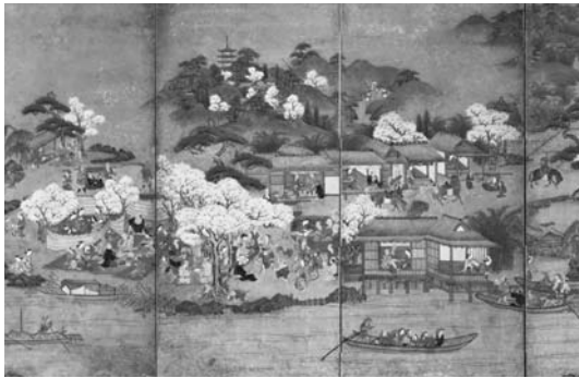
「淀橋本観桜図(部分)」(大阪歴史博物館蔵)

古来より淀川は京と西国とを結ぶ交通路として、人や物資が往来し、流域の人々に豊かな恵みをもたらしてきました。淀川を往来する舟は人や物だけでなく、情報や文化を運ぶ「みち」としても重要な役割を果たしてきました。今回の展覧会では「文化を運ぶみちとしての淀川」に焦点をあて、文人や画人が愛した淀川を紹介しします。