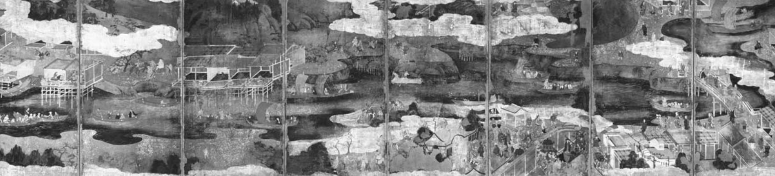
「淀川堤図」(大阪城天守閣蔵)