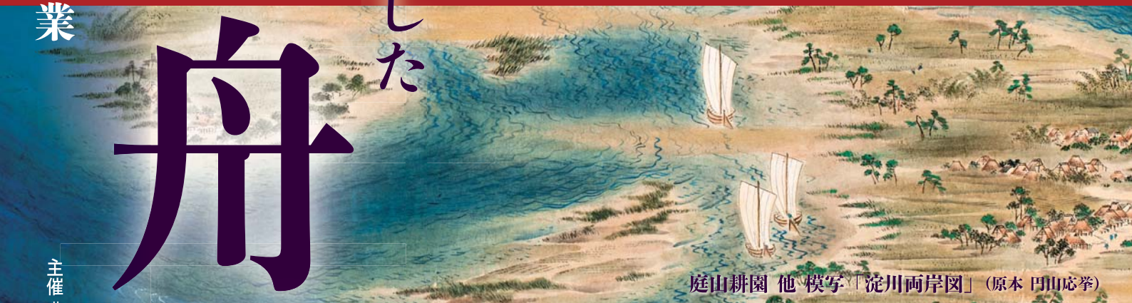
庭山耕園 他 模写「淀川兩岸図」(原本 円山応挙)