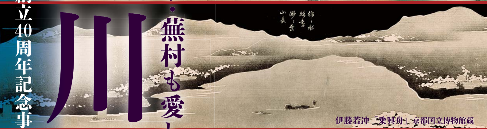
伊藤若冲「乘興舟」京都国立博物館蔵