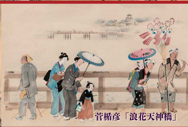
菅橋彦「浪花天神橋」