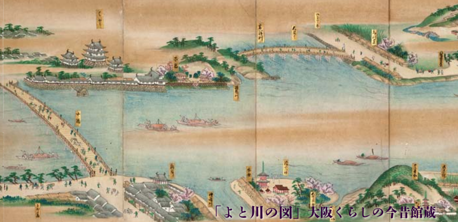
「よと川の図」大阪くらしの今昔館蔵